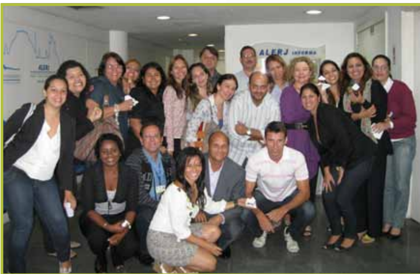
Em quatro anos, 80 turmas oferecidas pela Escola do Legislativo