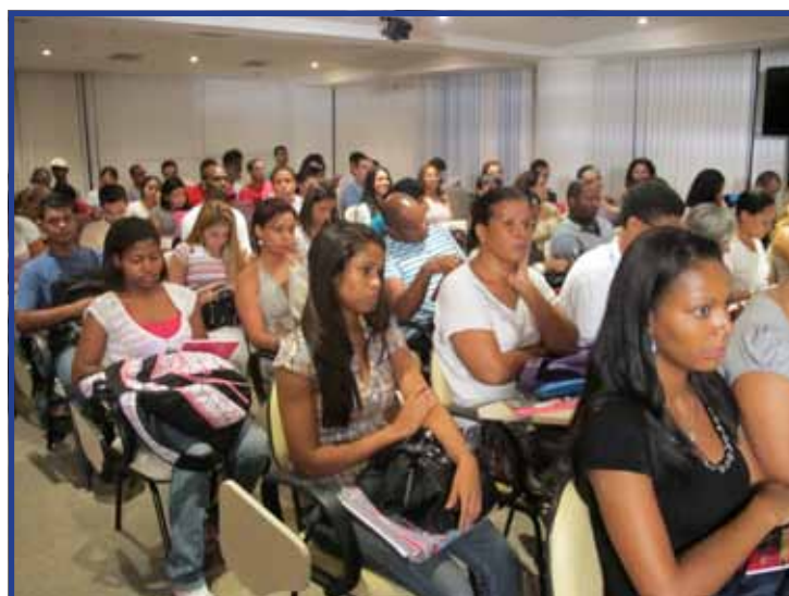
As salas de aula do Polo Elerj recebem alunos de diversos bairros e de outros municípios do Rio de Janeiro