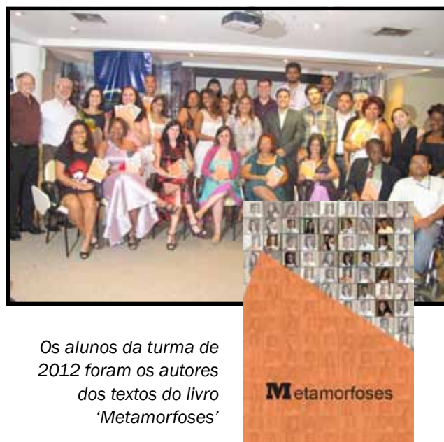
Os alunos da turma de 2012 foram os autores dos textos do livro ‘Metamorfoses’

A Educação de Jovens e Adultos também desenvolve um amplo trabalho de resgate de autoestima com atividades de valorização da história pessoal e de incentivo ao ensino formal e qualificação profissional. Neste sentido, foi iniciado no segundo semestre de 2011, o projeto ‘Livro da Vida’, com o objetivo de envolver os alunos no