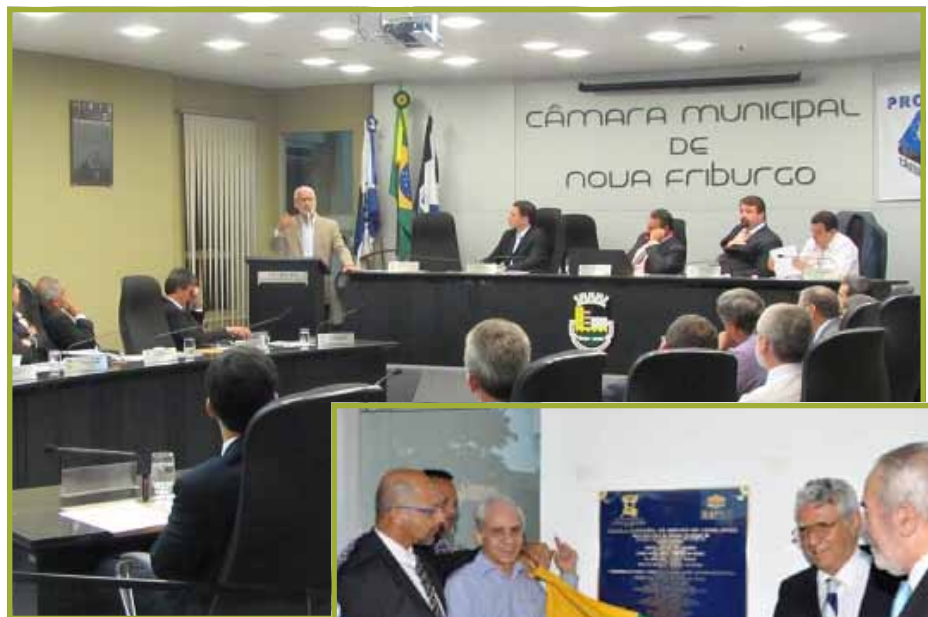
CM Nova Friburgo e CM Campos dos Goytacazes

A iniciativa mais recente, em novembro, foi a implantação da Escola Municipal de Gestão Pública do Legislativo (Emugle), em Campos dos Goytacazes, na Região Norte Fluminense. A solenidade de inauguração foi aberta pelo presidente da Associação Brasileira das Escolas do Legislativo e de Contas (ABEL), Florian Madruga, que, ao longo dos 11 anos da ABEL, tem sido incansável em peregrinar pelo país garantindo apoio institucional à criação e instalação de novas escolas nos municípios. “A Câmara de Campos está escrevendo a história. Podemos dizer que ela agora se divide em duas partes: antes e depois da Escola Municipal de Gestão Pública do Legislativo”, afirmou durante seu discurso.